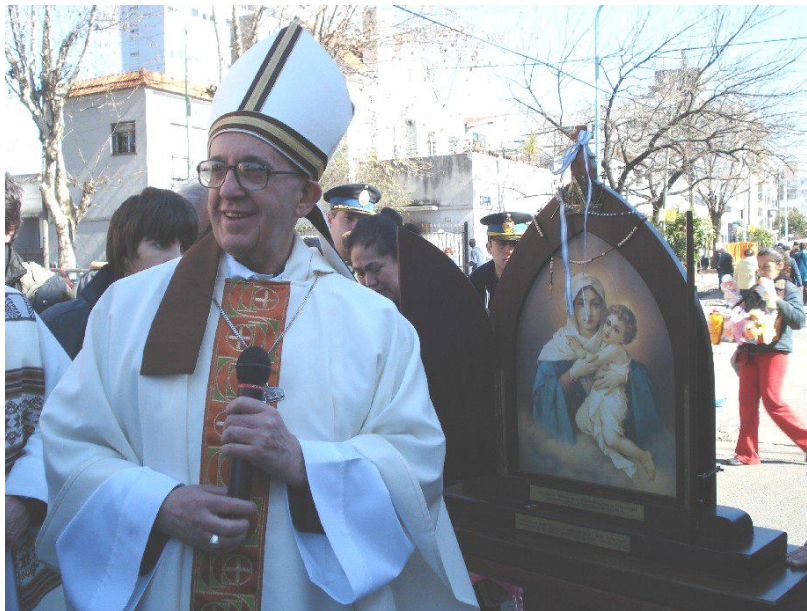
Sedanjšega papež, kot škof na ulicah Buenos Airesa