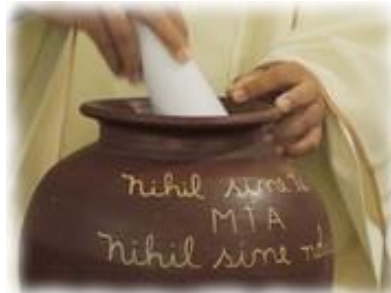
Nič brez tebe trikrat čudovita Mati, ničesar brez nas!

Vsi moji načrti in opravljeno delo, vse kar mi povzroča veselje in žalost, vse kar sem in kar imam, vse to Ti podarjam, kot dar ljubezni.