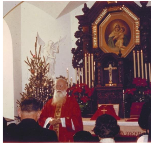
pater Joseph Kentenich mašuje v Prasvetišču